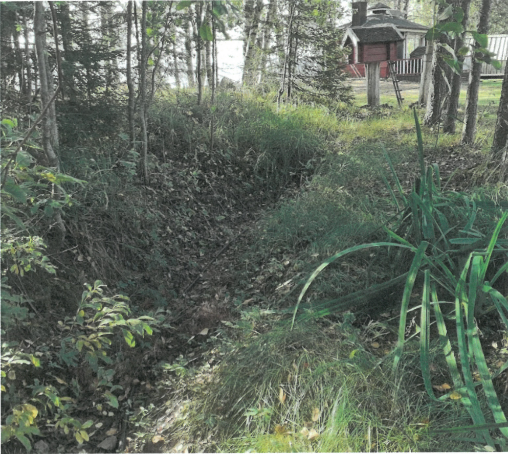
Kuva 6 ojan tulppaus lähempää, huomaa ojan reunojen korkeus ja veden virtaussuunta ojan täytyessä