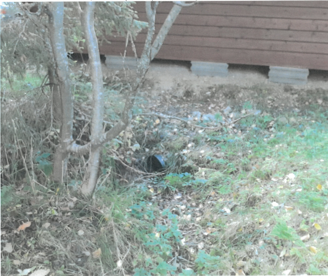
Kuva 4. ojaa rakennuksen alituksen jälkeen, tonttien rajamailta, huomaa vasemman reunan korkeus